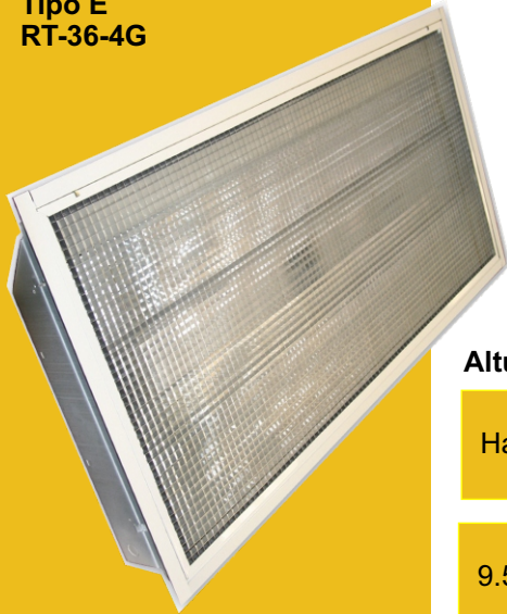
Tipo E RT-36-4G

la compuerta se cierra mediante seguros, el diseño de este módulo permite la disipación del calor proveniente de las balastras, se fabrica en dos versiones tipo E para falsos plafones y el tipo M para techos sólidos.